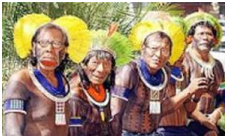
Ilustración 1: Indígenas Kayapo de Brasil que participaron, junto con otros pueblos indígenas, en la Conferencia de 1992.

Este movimiento viene de la mano con el redescubrimiento de los saberes locales como lo permite la protección de la biodiversidad, notablemente en la conferencia de Río ( Declaración de Río sobre el ambiente y el desarrollo ), en 1992